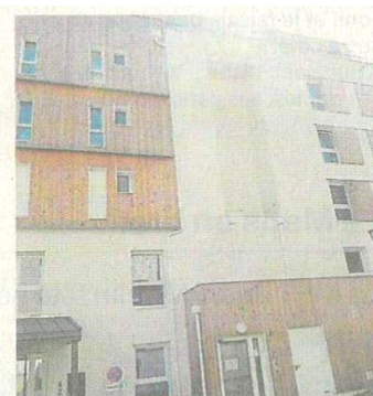
La Maison Rosa a été inaugurée samedi.

Le Département finance 180 millions d'euros annuels.